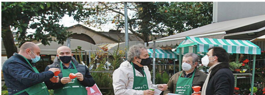
Mandiles y embudos para reciclar el aceite de la cocina

Medida 5. Concienciar e implicar máis aos homes na reciclaxe do fogar e na importancia de non malgastar enerxía (usos axeitados das caldeiras, aire acondicionado, luz, auga, elementos en stand-by ...).